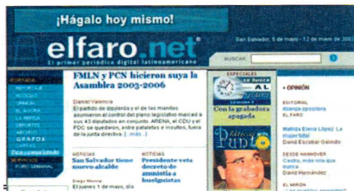
Tercera edición de El Faro en enero de 2003