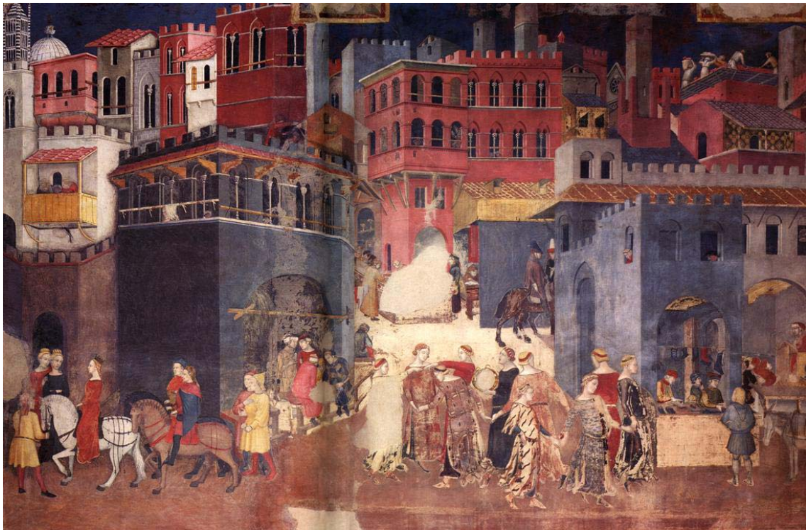
Fresc Efectes del Bon Govern d'Ambrosio Lorenzetti 1338-1340 Palau Públic de Siena