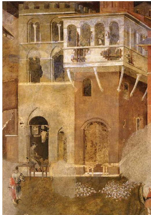
Fresc Efectes del Mal Govern d'Ambrosio Lorenzetti 1338-1340 Palau Públic de Siena