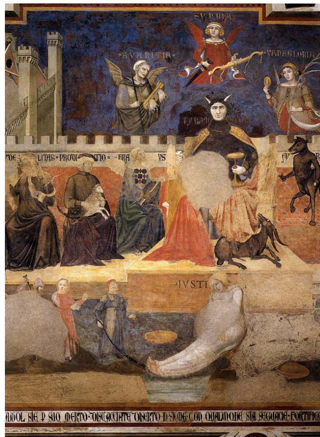
Fresc Allegoria del Mal Govern d'Ambrosio Lorenzetti, 1338-40 Palau Pùblic de Siena